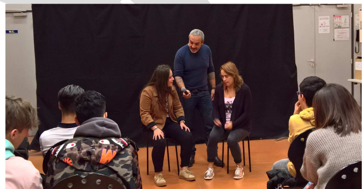
Débat avec le public, une jeune lycéenne parle à « Nina » personnage de la pièce

Le Pôle d'Appui Sécurité Routière de la Nouvelle-Aquitaine a renouvelé en 2017 l'opération régionale de responsabilisation des jeunes face à leurs conduites à risques à partir d'une pièce de théâtre interactive « Cocktails à gogo » , associant débat avec le public et information préventive . Fin novembre 2017, 7 lycées en Dordogne, soit 570 élèves , ont bénéficié de ces représentations de 2 heures. Cette action favorise les échanges sur les thématiques « sécurité routière », « citoyenneté » et « addictologies » avec pour objectif d'apporter aux organismes d'enseignement un outil leur permettant d'amener leurs jeunes à réfléchir sur leurs comportements .